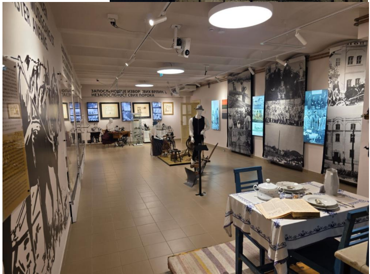
Donauschwäbisches Museum in Sombor