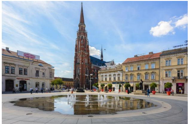
Bild oben: Ante-Starčević-Platz in Osijek

Hintergrund der Reise sowie in die Bedeutung der besuchten Orte für die Geschichte der Donauschwaben.