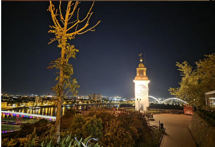
Novi Sad bei Nacht