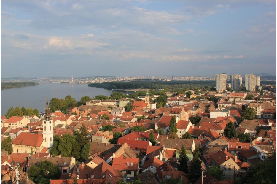
Blick über Zemun auf die Donau

Der Tag beginnt mit einem Gottesdienst bei der Deutschen Evangelischen Kirchengemeinde Belgrad, die als eigenständige lutherische Gemeinde im Jahr 2007 entstanden ist und seither regelmäßig Gottesdienste in der ehemaligen deutschen evangelischen Kirche in Zemun feiert.