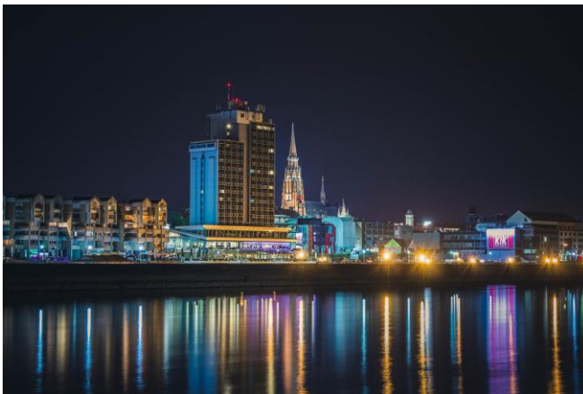
Osijek bei Nacht

Nach der individuellen Anreise zum Ihrem Abflughafen beginnt unsere gemeinsame Reise mit dem Flug ab München nach Osijek, dem kulturellen und wirtschaftlichen Zentrum Slawoniens. Die Stadt liegt an der Drau unweit ihrer Mündung in die Donau und war über Jahrhunderte ein bedeutender Ort der donauschwäbischen Siedlungsgeschichte.