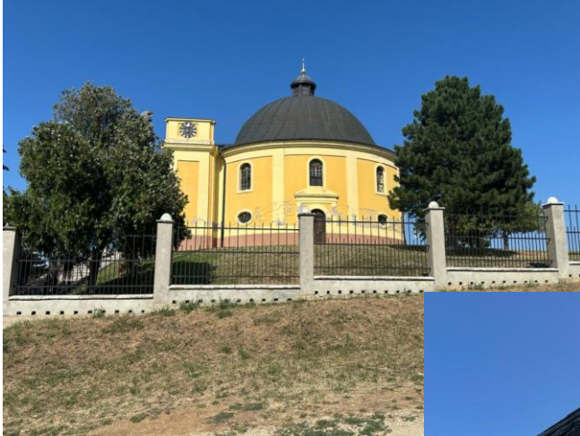
Bilder von Karlowitz:

Danach besuchen wir Karlowitz, ein historisches Zentrum der Region. Im Donauschwäbischen Heimathausmuseum werden wir mit Kaffee und Guglhupf empfangen und besichtigen die Friedenskapelle, die an den Frieden von Karlowitz (1699) erinnert. Das Abendessen nehmen wir in einem wunderschön gelegenen Restaurant direkt an der Donau ein.