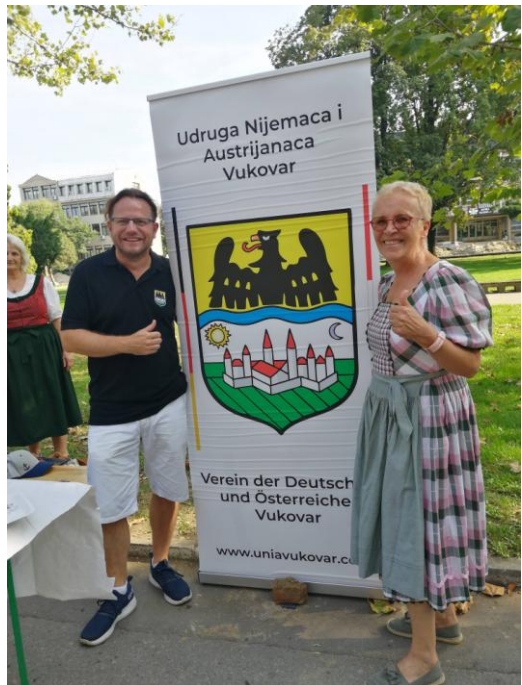
Deutsch-Österreichischer Verein in Vukovar

Der Tag endet mit einem Empfang bei der Deutschen Gemeinschaft in Osijek, der Gelegenheit zu Gesprächen und Begegnungen bietet.