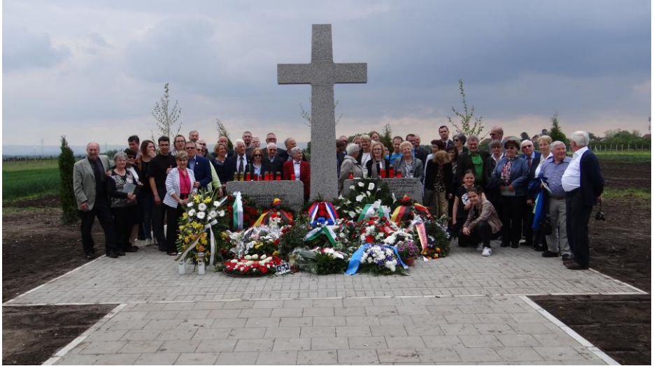
Gedenkstätte in Jarek

Wir besuchen die Gedenkstätte Jarek und erinnern an die dort internierten Menschen. Danach fahren wir ins Banat nach Zrenjanin, wo wir eine Stadtführung erhalten und die architektonischen Zeugnisse der habsburgischen Zeit sehen.