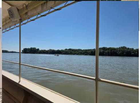
Bilder von Apatin: Herz-Jesu-Kirche mit Kirchenmuseum, Verein „Adam Berenz“, Bootsfahrt auf der Donau