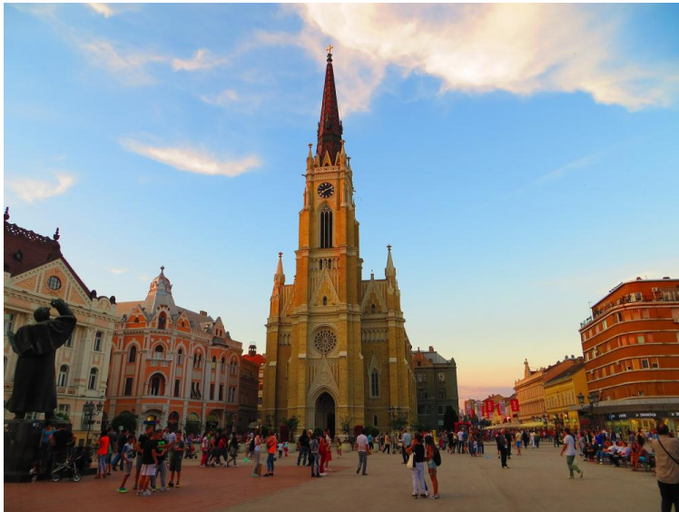
Am Hauptplatz Trg Slobode in Novi Sad

Am Nachmittag erreichen wir Novi Sad, die Hauptstadt der Vojvodina. Nach dem Hotelbezug beschließen wir den Tag mit einem Abendessen an der Donaupromenade.