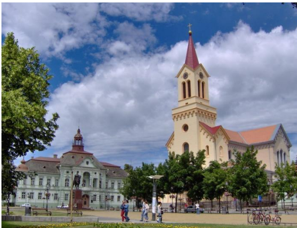
Freiheitsplatz in Zrenjanin

Nach dem Mittagessen fahren wir nach Kačarevo, das einst das größte evangelische Dorf im jugoslawischen Banat war, und besuchen das Rathaus, den Friedhof und die Parkanlage. Je nach Wetter besteht die Möglichkeit zu einer