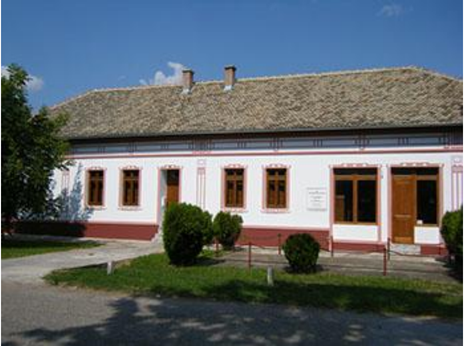
Donauschwäbische Heimatstube in Sekitsch

Dienstag, 4. August – Sombor, Lovćenac (Sekitsch), Maglić (Bulkes) und Novi Sad (Neusatz)