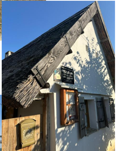
Friedenskapelle, Donauschwäbisches Museum, Restaurant an der Donau