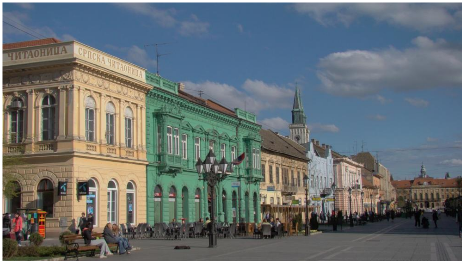
Kralja Petra StraÙe in Sombor, ©Wikipedia, Dekanski

Der Vormittag ist dem Gedenken gewidmet. Wir besuchen die ehemaligen Lagerorte Gakovo und Kruševlje, in denen nach 1945 viele Donauschwaben interniert waren. Mit Kranzniederlegungen erinnern wir an die Opfer dieser Zeit. Die Besuche erfolgen in stiller und würdiger Form.