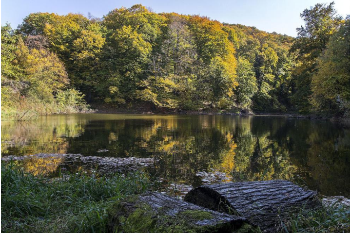
Fruška Gora

Der Tag beginnt mit einer Fahrt in den Nationalpark Fruška Gora, der für seine orthodoxen Klöster und Weinberge bekannt ist. Wir besichtigen eines der Klöster und erhalten Einblick in die religiöse Tradition der Region.