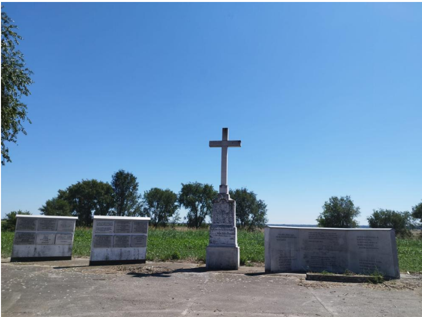
Gedenkstätte in Rudolfsgnad

Anschließend nehmen wir am Dorffest zum 160-jährigen Bestehen des Ortes teil – eine besondere Gelegenheit zur Begegnung mit der heutigen Bevölkerung und den Vereinen der deutschen Minderheit. Der Ort wurde im 19. Jahrhundert als planmäßige deutsche Siedlung gegründet und nach dem Kronprinzen Rudolf benannt. Wie viele Banater Kolonistendörfer war Rudolfsgnad geometrisch angelegt, mit breiten Straßen, einer zentralen Kirche, Schule und Gemeindehaus. Bis zum Zweiten Weltkrieg war Rudolfsgnad eine fast ausschließlich deutschsprachige, überwiegend evangelische Gemeinde. Mit dem Einmarsch der Partisanen im Herbst 1944 begann für die deutsche Bevölkerung eine Zeit von Enteignung, Internierung und Entrechtung. Die Bewohner wurden aus ihren Häusern vertrieben; der Ort wurde in ein Internierungslager für Deutsche aus der Region umgewandelt. Das Lager Rudolfsgnad gehörte zu den größten und schwersten Lagern in der alten Heimat. Tausende Menschen – vor allem Frauen, Kinder und ältere Männer – wurden hier festgehalten. Hunger, Krankheiten und unzureichende medizinische Versorgung führten zu zahlreichen Todesfällen. Der Ort steht heute stellvertretend für das Schicksal der donauschwäbischen Zivilbevölkerung in der Nachkriegszeit. Gemeinsam mit den heutigen Bewohnern gedenken wir den Internierten und Opfern.